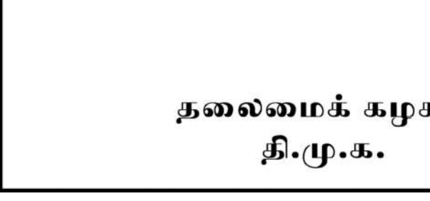
தலைமைக் கழகம் தி.மு.க.