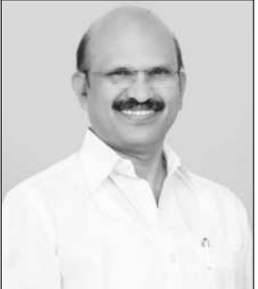
கனின் தலைமையில் தருமபுரி மாவட்டத்திற்கு உட்பட்ட ஐந்து சட்டமன்ற தொகுதியில் உள்ள தேர்தல் பணிக்குழு ஒருங்கிணைப்பாளர்கள் மற்றும் வாக்குச்சாவு முகவர்கள் (BLA2)