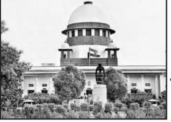
அம்மாநில முதலமைச்சரின் கருத்தை ஆளுநர் இதனால், துணைவேந்தர் நியமனத்தில் தேடுதல் தேர்வுக்குழு அமைத்து, தலைவராக முன்னாள் நீதிபதி