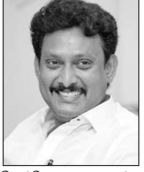
திருச்சி வருகை தந்து திருச்சி மாவட்டத்தில் மதிமுக பொதுச் செயலாளர் வைகோ அவர்கள் ின் சமத்துவ நடைபய

திருச்சி, ஜன.1- திருச்சி தெற்கு மாவட்டச் செயலாளர் - அமைச்சர் அன்பில் மகேஸ் பொய்யாமொழி விடுத்துள்ள அறிக்கை வருமாறு:- திருச்சி மாவட்டத் திற்கு வருகை தரும் கழகத் தலைவர் - தமிழ்நாடு முதலமைச்சர் அவர்கள் நாளை (02/01/2026 - வெள்ளிக்கிழமை) காலை 8 மணி யளவில் சென்னையில் இருந்து விமானம் மூலம்