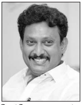
திருச்சி வருகை தந்து திருச்சி மாவட்டத்தில் மதிமுக பொதுச் செயலாளர் வைகோ அவர்கள் ின் சமத்துவ நடைபய

திருச்சி, ஜன.1- திருச்சி தெற்கு மாவட்டச் செயலாளர் - அமைச்சர் அன்பில் மகேஸ் பொய்யாமொழி விடுத்துள்ள அறிக்கை வருமாறு:- திருச்சி மாவட்டத் திற்கு வருகை தரும் கழகத் தலைவர் - தமிழ்நாடு முதலமைச்சர் அவர்கள் நாளை (02/01/2026 - வெள்ளிக்கிழமை) காலை 8 மணி யளவில் சென்னையில் இருந்து விமானம் மூலம்