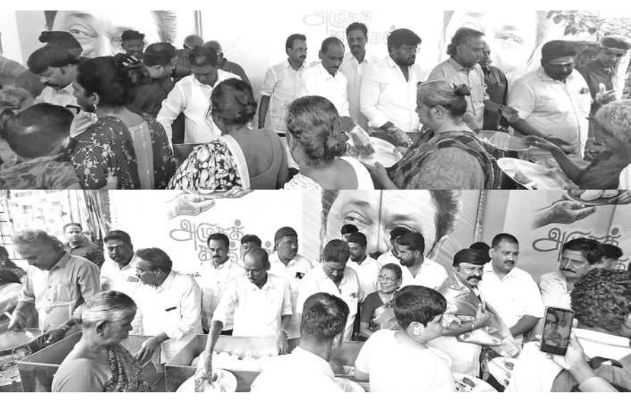
நகர், காளியம் மன் 2வது தெரு (அருகில் பால் கோயில் அருகில்), சென்னை வட்டம் 98, அம்பேத்கர் நகர் ஆகிய பகுதிகளில் மாண்பு

சென்னை, ஜன. 1- முதலமைச்சர் அவர்களின் 72வது பிறந்த நாளையொட்டி சென்னை கிழக்கு மாவட்ட திமுக சார்பில், 2025 பிப்ரவரி 20ஆம் தேதி முதல், 2026 பிப்ரவரி 19ஆம் தேதி வரையிலான 365 நாட்களும், நாள் ஒன்றுக்கு 1000 நபர்களுக்கு காலை உணவு வழங்கும் சிறப்புமிக்க “அன்னம் தரும் அமுதகரங்கள்” மாபெரும் திட்டத்தின் 315 ஆம் நாளான - கழகத் தலைவர் தமிழ்நாடு முதலமைச்சர் அவர்களின் இனிய பிறந்தநாளையொட்டி நேற்று (31.12.2025), வில்லிவாக்கம் கிழக்கு பகுதி: 1) வட்டம் 98 அ, வாக் கா