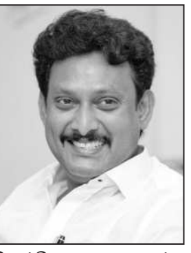
திருச்சி வருகை தந்து திருச்சி மாவட்டத்தில் மதிமுக பொதுச் செயலாளர் வைகோ அவர்கள் சமத்துவ நடைபய