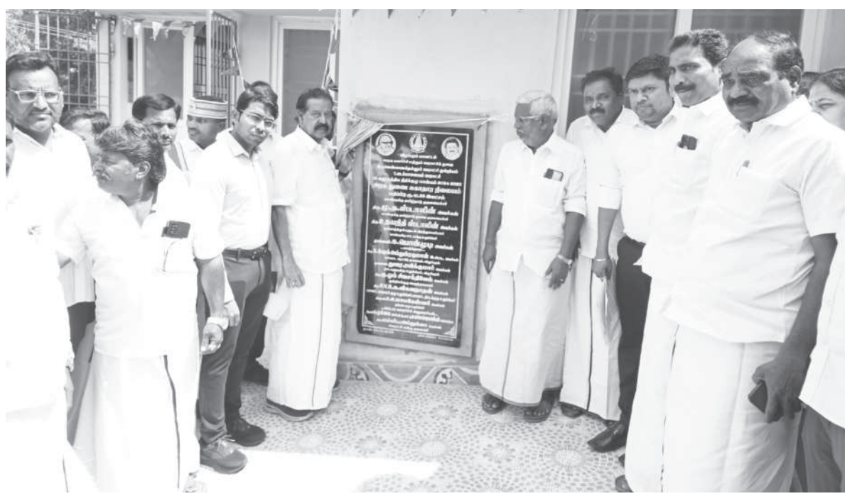
முதலமைச்சர் தளபதியார் அவர்களின் நல்வழித்துக்களுடன் திருக்கோவிலூர் சட்டமன்றத் தொகுதி, திருவெண்ணெய்நல்லூர் ஊராட்சி ஒன்றியம், தி.எப்பாளையம் ஊராட்சியில் புதியதாக கட்டப்பட்ட அரசு துணை ஆரம் பக்காதார நிலையத்தை முன்னாள் அமைச்சர் திருக்கோவிலூர் சட்டமன்ற உறுப்பினர் முனைவர் க. பொன்முடி பொதுமக்களின் பயன்பாட்டிற்கு திறந்து வைத்தார்.