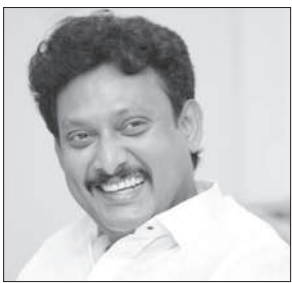
போராட்டக்களத்தில் இருக்கும் ஆசிரியர்கள் பள்ளிக்கு திரும்பி கற்பித்தல் பணிகளில் ஈடுபடக் கேட்டுக் கொள்கின்றேன்.