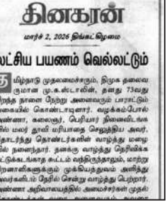
இவ்வாறு அத்தலைவங்கத்தின் குறிப்பிடப்பட்டுள்ளது.