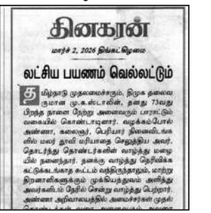
தினகரன் லட்சியப் பயணம் வெவ்வேறும்

இவ்வாறு அத்தலைவங்கத்தில் குறிப்பிடப்பட்டுள்ளது.