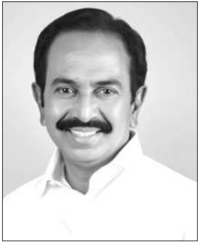
மீது அக்கறை கொண்ட கழக அரசு கரும்பு சாகுபடி பரப்பை அதிகரிப்பதற்காகவும், சர்க்கரை ஆலைகளின் செயல்திறனை மேம்படுத்துவதற்காகவும் பல்வேறு ஆக்கப்பூர்வமான நடவடிக்கைகளை மேற்கொண்டு வருகிறது. அதன் ஒரு பகுதியாக கரும்பு விவசாயிகளுக்கு உடனடி தொகை வழங்கி வருகிறது.