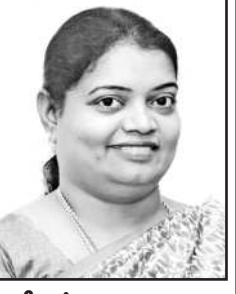
அமைச்சர் பி.கீதாஜீவன் செயலாளர் - தூத்துக்குடி வடக்கு மாவட்ட தி.மு.க.

மாவட்டச் செயலாளர் - அமைச்சர் பி.கீதாஜீவன் அறிவிப்பு! தூத்துக்குடி வடக்கு மாவட்டத்தில் தி.மு.க. அவசர செயற்குழுக் கூட்டம் நாளை (4.3.2026 - புதன்கிழமை) மாலை 6.00 மணி அளவில் மாவட்ட அமைச்சர் ஜி.செல்வராஜ் தலைமையில் கலைஞர் அரங்கம் தூத்துக்குடியில் நடைபெறுகின்றது. இக்கூட்டத்தில் மாவட்டக் கழக நிர்வாகிகள், தலைமைச் செயற்குழு, பொதுக்குழு உறுப்பினர்கள், மாநில அணி துணை செயலாளர்கள், மாநகர, நகர, ஒன்றிய, பகுதி, பேரூர் கழகச் செயலாளர்கள், கழக சார்பு அணிகளின் மாவட்ட அணி அமைப்பாளர்கள் அனைவரும் தவறாது கலந்து கொள்ளுமாறு கேட்டுக்கொள்கிறேன். பொருள் : 1. மார்ச் - 9 அன்று திருச்சி கழக மாநாட்டில் கலந்துகொள்வது குறித்து 2. கழக வளர்ச்சிப் பணிகள் குறித்து