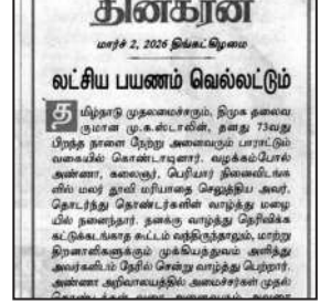
இவ்வாறு அத்தலைவங்கத்தில் குறிப்பிடப்பட்டுள்ளது.

ஆட்சிக்கு ஊறு விளைவிக்க முயன்ற போதெல்லாம் தன் போர் திறத்தால் அவற்றை வென்று காட்டியவர் தமிழக முதல்வர். திராவிட மாதல் அரசின் திட்டங்களும், சாதனைகளும் இன்று தனிக்குணம் கொண்ட தமிழர்கள் தலைநிமிர்ந்து நிற்க வழிகோலியுள்ளது. கூழ்ந்து வந்த சூழ்ச்சிகளை தமிழகம் இன்று முதல்வர் தலைமையில் முறியடித்து, நாட்டிற்கே புத்தொளி