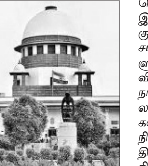
துள்ளது. மேலும், வாக்காளர்கள்

திற்கு எதிராக உள்ளதாகவும், எந்தவித முன்னறிவிப்பும் இன்றி வாக்காளர் பட்டியலில் இருந்து பெயர்கள் நீக்கப்படுவது மிகவும் ஆபத்தானது என்றும் உச்சநீதிமன்றம் கவலை தெரிவித்துள்ளது. எஸ்.ஐ.ஆர். பணிகளின் போது, மேற்குவங்கத்தில் பலருக்கு முறையாக படிவம் வழங்கப்படவில்லை என்றும் குற்றச்சாட்டு எழுந்