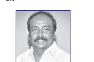
மருது அழகராஜ் கழகச் செய்தித் தொடர்புக் குழு துணைத் தலைவர்

எடப்பாடியின் பதற்றத்தையும் படுதோல்விக்கு காத்திருக்கும் அ.தி.மு.க.வின் பரிதாப நிலையை யுமே காட்டுகிறது..