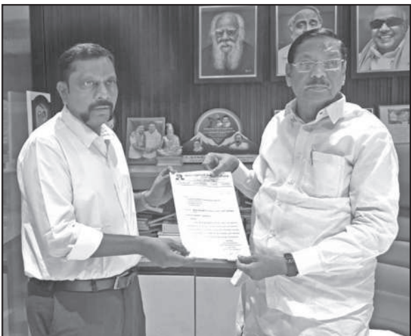
முன்தினம் (26.03.2026) அறிவாலயத்தில் உள்நாட்டு அமைச்சர் அண்ணா கழக அலுவலகத்தில் கழக

சென்னை, மார்ச் 28 - நடைபெறவிருக்கும் 2026 சட்டப்பேரவை பொதுத்தேர்தலில் தி.மு.க. தலைமையிலான மதச்சார்பற்ற முற்போக்குக் கூட்டணிக்கு, 'இம்மானுவேல் சேகரனார் மிஷன்' ஆதரவு தெரிவித்துள்ளது.