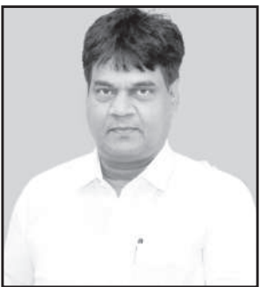
ஒன்றிய அரசு தேசிய கல்விக் கொள்கை ஏதோ மிகவும் உயர்ந்த திட்டம் போன்று ஒரு பிம்பத்தை ஏற்படுத்துகிறது. அதில், மாணவர்களுக்கு இந்தியாவில் உள்ள 22 மொழிகளையும், 5 வெளிநாட்டு மொழிகளையும், அதாவது ஸ்பானிஷ் மற்றும் ஜப்பானின் மொழிகள் உள்ளிட்ட வெளிநாட்டு மொழிகளையும் கற்பிக்க திட்டமிட்டுள்ளதாகத் தெரிவிக்கப்படுகிறது.

புதுடெல்லி, மார்ச் 28 - "தேசியக் கல்விக் கொள்கை என்ற பெயரில் இந்தியை திணிப்பது சரியல்ல" என்று நாடாளுமன்ற மக்களவையில் கழக உறுப்பினர் டாக்டர் கலாநிதி வீராசாமி கூறினார்.