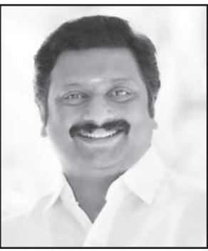
எழுப்பப்பட்ட கேள்விகளுக்கு பதிலளித்த வீடமைப்பு மற்றும் நகர்ப்புற விவகாரங்கள் அமைச்சர் மனோஹர் லால், இதுகுறித்து விரிவான அறிக்கையை அவையில் வைத்துள்ளோம்.