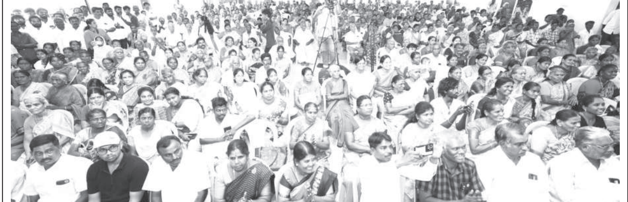
கரும் நடவடிக்கை பாயும் கேள் செலவுக்கு தனி கட்டணம் ஒட்டல்கள் வசூலிக்கக் கூடாது: நுகர்வோர் ஆணையம் எச்சரிக்கை!

இது குறித்து மத்திய நுகர்வோர் பாதுகாப்பு ஆணையம் நேற்று வெளியிட்ட அறிக்கையில் கூறியிருப்பது: தேசிய நுகர்வோர் உதவி மையத்தில் பெறப்பட்ட புகார்கள் மற்றும் ஊடக அறிக்கைகளின் அடிப்படையில், சில ஒட்டல்கள் மற்றும் உணவுக்கள் நுகர்வோருக்கு வழங்கும் பில்ல்களில் 'எப்.ஜி.டி கட்டணம்', 'எரிவாயு கட்டுக் கட்டணம்' மற்றும் 'எரிவாயு செலவு மீட்டி' போன்ற கட்டுக் கட்டணங்கள் வசூலிப்பதை சிசிபிஏத் தீவிரமாக கவனத்தில் கொண்டுள்ளது.