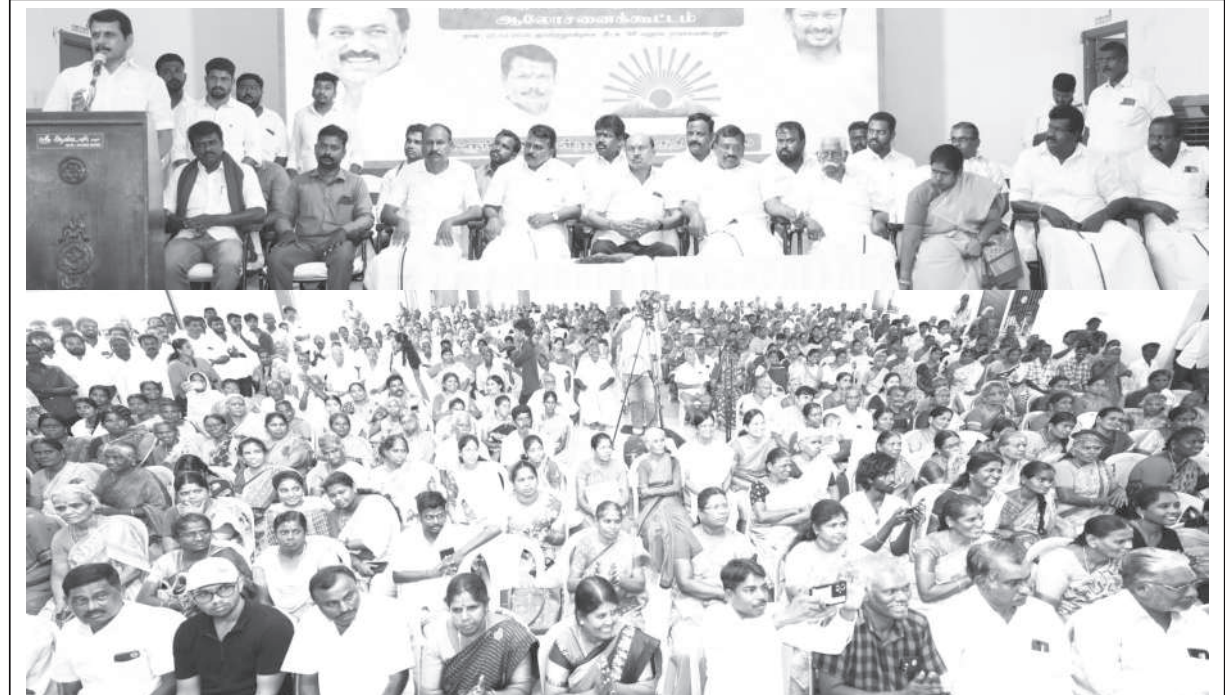
கருர் சட்டமன்ற தொகுதி, கருர் தெற்கு பகுதி கழக செயல்வீரர்கள் கூட்டம் ராமகவுண்டூர் எம்.பி. மகாலில் நடைபெற்றது. கருர் மாவட்ட கழக செயலாளர் வி.செந்தில்பாலாஜி எம்.எல்.ஏ. சிறப்புரையாற்றினார். சட்டமன்ற உறுப்பினர்கள், மாநில நிர்வாகிகள், தலைமை செயற்குழு, பொதுக்குழு உறுப்பினர்கள், மாவட்ட கழக, பகுதி கழக, வட்ட கழக நிர்வாகிகள், புதுமணலா) வேறுப்பாளர்கள், புதுமணலா, மாவட்டம், பகுதி, வாட்டு சாப்பு அணி அமைப்பாளர்கள் மற்றும் துணை அமைப்பாளர்கள், கழக முன்னோடிகள், உள்ளாட்சி பிரதிநிதிகள் மற்றும் மதச்சார்பற்ற முற்போக்கு கூட்டணி கட்சிகளின் நிர்வாகிகள் ஆயிரக்கணக்கில் கலந்து கொண்டனர்.

அவர்களும் திராவிட நாயகர் தளபதி மு.க.ஸ்டாலின் அவர்களும் ஆன்மீகத்தில் ஈடுபாடு கொண்ட அனைத்து தரப்பு மக்களின் எண்ணங்களையும், விருப்ப வேறுபாடுகளின்றி ஈடுபாட்டில் வகையில் திருவாரூர் தியாகராஜர் சுவாமிகள் கோவில் மற்றும் ஆழித்தேரின் பெருமைகளை உலகறிய செய்தார்கள்.