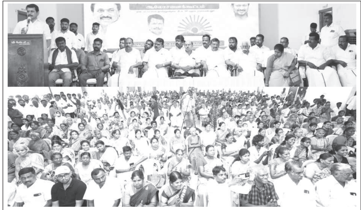
கருர் சட்டமன்ற தொகுதி, கருர் தெற்கு பகுதி கழக செயல்வீரர்கள் கூடம் ராமகவுண்டூர் எம்.பி. மகாலில் நடைபெற்றது. கருர் மாவட்ட கழக செயலாளர் வி.செந்தில்பாலாஜி எம்.எல்.ஏ. சிறப்புரையாற்றினார். சட்டமன்ற உறுப்பினர்கள், மாநில நிர்வாகிகள், தலைமை செயற்குழு, பொதுக்குழு உறுப்பினர்கள், மாவட்ட கழக, பகுதி கழக, வட்டி கழக நிர்வாகிகள், புதுமணலா (பெருமணலா) பெருமணலா, புதுமணலா, மாவட்டம், பகுதி, வாட்டு சாப்பு அணி அமைப்பாளர்கள் மற்றும் துணை அமைப்பாளர்கள், கழக முன்னோடிகள், உள்ளூர் பிரதிநிதிகள் மற்றும் மதச்சார்பற்ற முற்போக்கு கூட்டணி கட்சிகளின் நிர்வாகிகள் ஆயிரக்கணக்கில் கலந்து கொண்டனர்.

இப்படி கழக ஆட்சிகள் போதெல்லாம் மெருகூட்டப்பட்ட தியாகராஜர் சுவாமிகள் கோவிலில் ஆழித்தேரோட்டம் நடைபெறும் 29.03.2026 ரூயியறு அன்று நடைபெறுகிறது. தமிழ்நாடு முதலமைச்சர் தளபதி மு.க.ஸ்டாலின் அவர்களும், பிரகார புணரமைப்புக்கள் உள்ளிட்ட பல்வேறு வசதிகளை இந்த கோயில் கண்டிருக்கிறது. பகுத்தறிவு பகலின் தந்தை பெரியாரின் கலைஞர்