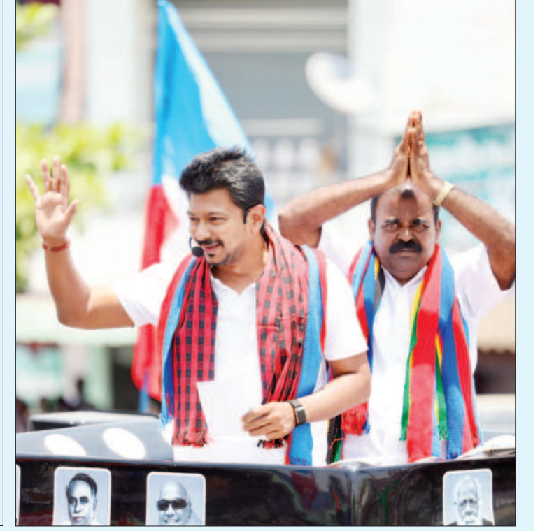
● திருவண்ணாமலை திருவள்ளூர் சிலை பகுதியில் திருவண்ணாமலை சட்டமன்றத் தொகுதியின் கழக வேட்பாளர் மாண்புமிகு அமைச்சர் எ.வ.வேலு அவர்களை ஆதரித்து பரப்புரை மேற்கொண்டார்.