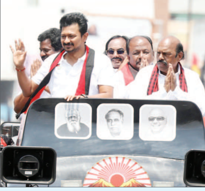
● திருவண்ணாமலை திருவள்ளூர் சிலை பகுதியில் திருவண்ணாமலை சட்டமன்றத் தொகுதியின் கழக வேட்பாளர் மாண்புமிகு அமைச்சர் எ.வ.வேலு அவர்களை ஆதரித்து பரப்புரை மேற்கொண்டார்.

2026 சட்டமன்றத் தேர்தலில், மதச்சார்பற்ற முற்போக்குக் கூட்டணி கட்சிகளின் வேட்பாளர்களை ஆதரித்து, கழக இளைஞர் அணிச் செயலாளரும் துணை முதலமைச்சருமான உதயநிதி ஸ்டாலின் அவர்கள், 31.3.2026 அன்று திருவண்ணாமலை, அரூர், பாப்பிரெட்டிப்பட்டி, பாலக்கோடு, தனி, ஓசூர், வேப்பனஹள்ளி சட்டமன்றத் தொகுதிகளில் பரப்புரை மேற்கொண்டபோது எடுக்கப்பட்ட புகைப்படங்களின் தொகுப்பு: