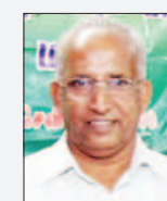
கவிப்பேராளர் நீரை அத்திப்பு (சே-அத்துல் லத்தீப்)