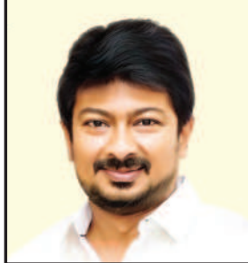
வெள்ளிக்கிழமை காலை 7.00 மணி முதல் பிரச்சார

சென்னை, ஏப்.3- சென்னை மேற்கு மாவட்ட தி.மு.க. திருவல்லிக்கேணி பகுதி 116வது வட்டத்தில் கழக வெற்றி வேட்பாளர் உதயநிதி ஸ்டாலின் அவர்கள் இன்று காலையில் நடந்து சென்று வாக்கு சேகரிக்கிறார். இன்று (03.04.2026) காலை 7.00 மணி முதல் பிரச்சார