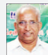
கவிப்பேராளர் நீரே அத்திப்பு (சே-அத்துல் லத்தீப்)