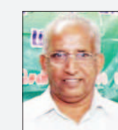
கவிப்பேராளர் நீரே அத்திப்பு (சே-அத்துல் லத்தீப்)