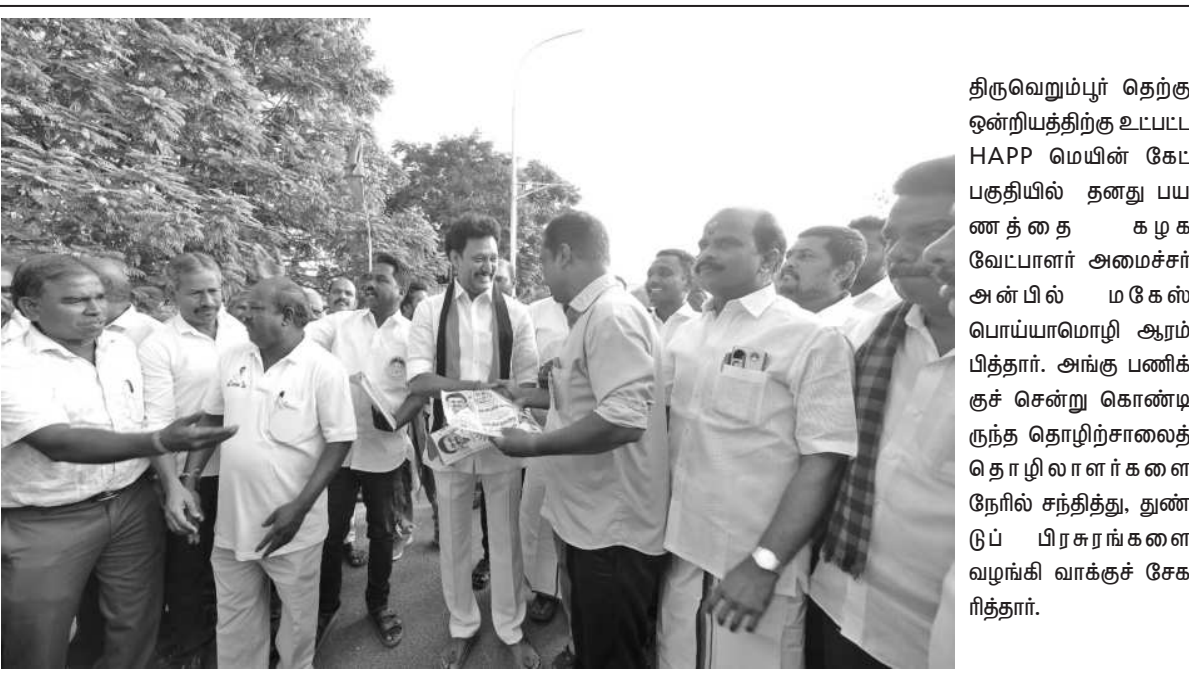
திருவெறுமபூர் தெற்கு ஒன்றியத்திற்கு உட்பட HAPP மெயின் கேட பகுதியில் தனது பயணத்தை கழக வேட்பாளர் அமைச்சர் அன்பில் மகேஸ் பொய்யாமொழி ஆரம்பித்தார். அங்கு பணிக் குச் சென்று கொண்டிருந்த தொழிற்சாலைத் தொழிலாளர்களை நேரில் சந்தித்து, துண்டுப் பிரசுரங்களை வழங்கி வாக்குச் சேகரித்தார்.

"அண்ணா அறிவாலயம்" தலைமைக் கழகம் சென்னை - 600 018 நாள் - 31.03.2026 தி.மு.க.