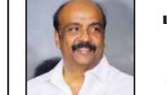
மருது அழகுராசு கழகச் செய்தித் தொடர்புக் குழு துணைத் தலைவர்