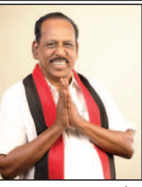
உத்திரமேரூர் சட்டமன்ற தொகுதி மதச்சார்பற்ற முற்போக்கு கூட்டணி கட்சிகள்.