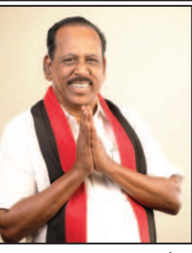
உத்திரமேரூர் சட்டமன்ற தொகுதி மதச்சார்பற்ற முற்போக்குக் கூட்டணி கட்சிகள்.