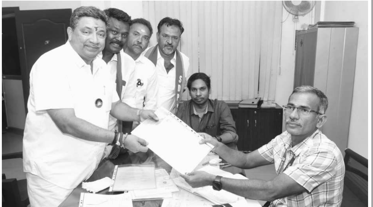
மதுரை மத்திய தொகுதி கழக வேட்பாளர் தகவல் தொழில்நுட்பம் மற்றும் டிஜிட்டல் சேவைகள் துறை அமைச்சர் பி.டி.ஆர். பழனிவேல் தியாகராஜன் மதுரை மாநகராட்சி மத்திய மண்டல அலுவலகத்தில் கழகத்தினர் மற்றும் கூட்டணிக் கட்சி நிர்வாகிகளுடன் சென்று தனது வேட்பு மனுவை தாக்கல் செய்தார்.