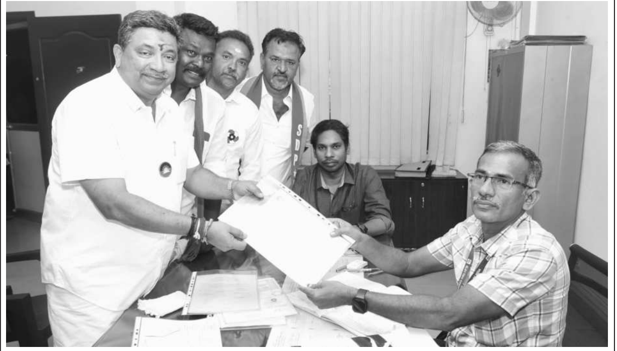
மதுரை மத்திய தொகுதி கழக வேட்பாளர் தகவல் தொழில்நுட்பம் மற்றும் டிஜிட்டல் சேவைகள் துறை அமைச்சர் பி.டி.ஆர். பழனிவேல் தியாகராஜன் மதுரை மாநகராட்சி மத்திய மண்டல அலுவலகத்தில் கழகத்தினர் மற்றும் கூட்டணிக் கட்சி நிர்வாகிகளுடன் சென்று தனது வேட்பு மனுவை தாக்கல் செய்தார்.