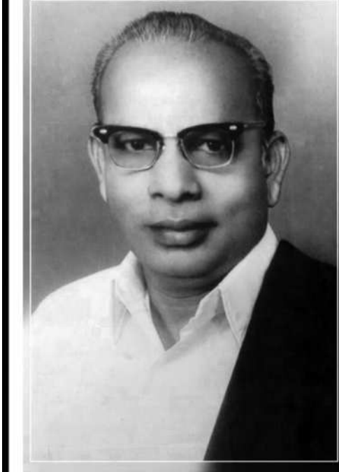
தோற்றம் - 5.6.1921 மறைவு : 8.4.1981