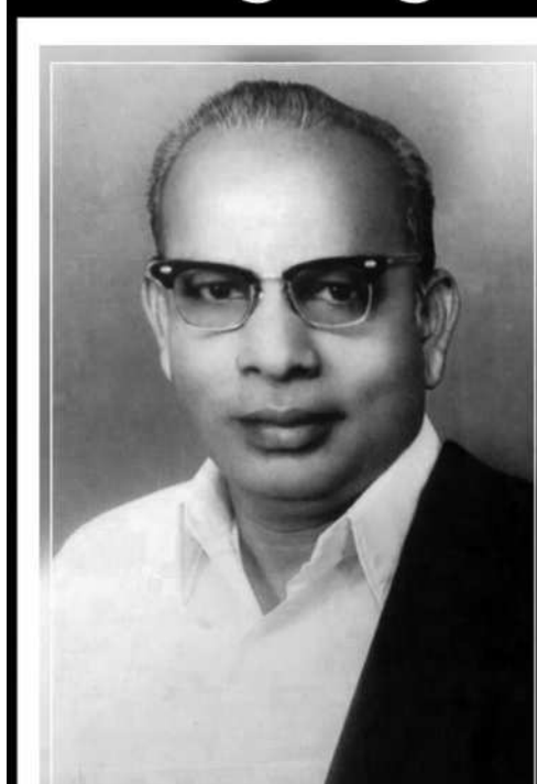
தோற்றம் - 5.6.1921 மறைவு : 8.4.1981