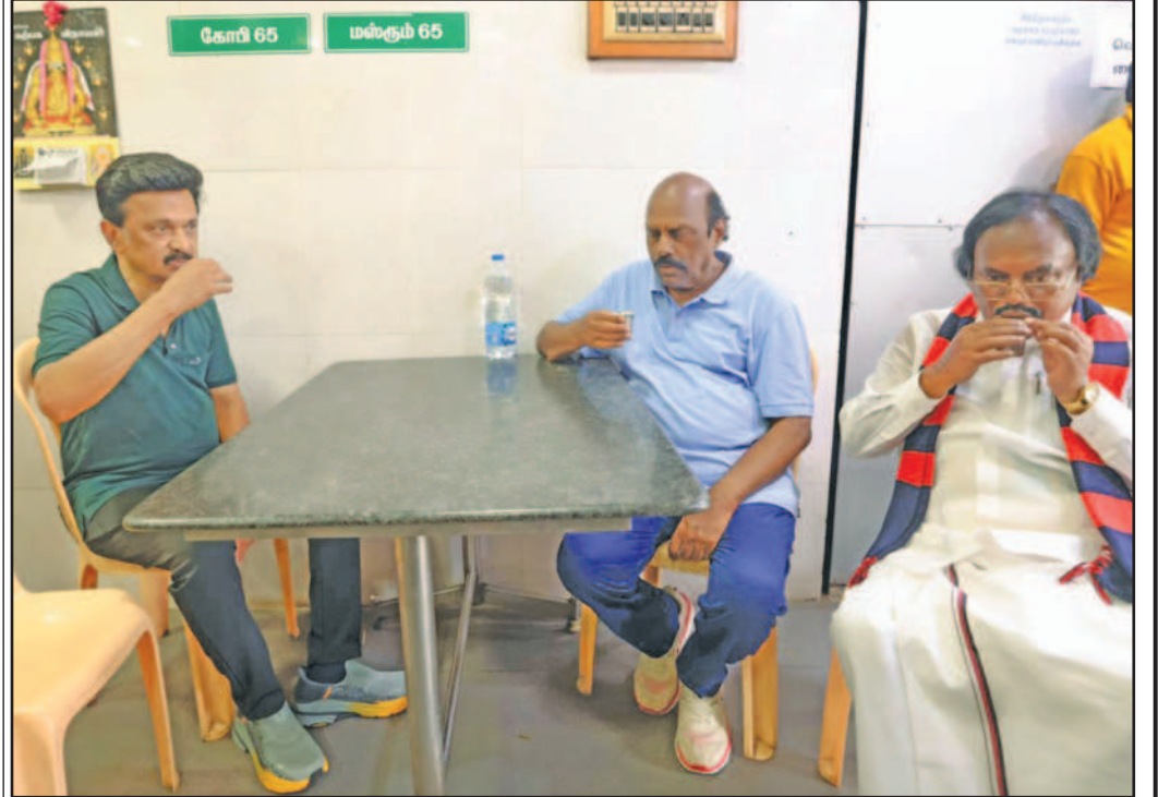
கழகத் தலைவரும் - முதலமைச்சருமான மு.க.ஸ்டாலின் அவர்கள் நேற்று (8.4.2026) காலை திருவண்ணாமலையில் நடையணம் மேற்கொண்டபோது, அங்கு பொதுமக்களைச் சந்தித்து, திருவண்ணாமலை தொகுதி கழக வேட்பாளர் அமைச்சர் எ.வ.வேலு அவர்களை ஆதரித்து வாக்குச் சேகரித்தார்.