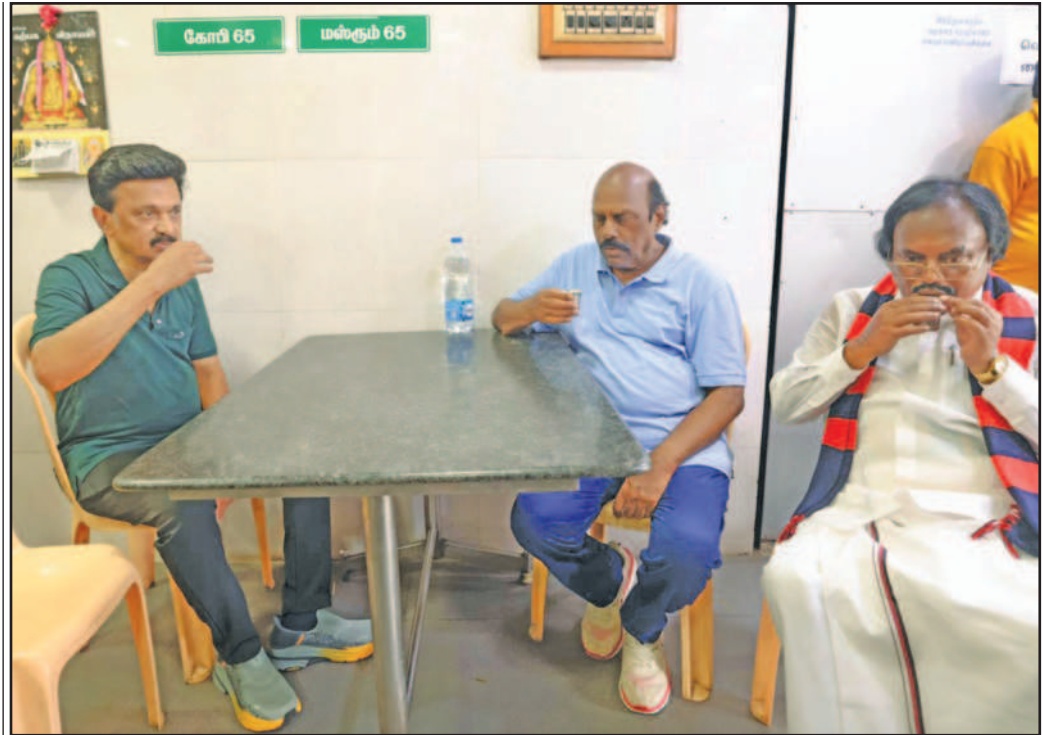
கழகத் தலைவரும் - முதலமைச்சருமான மு.க.ஸ்டாலின் அவர்கள் நேற்று (8.4.2026) காலை திருவண்ணாமலையில் நடையணம் மேற்கொண்டபோது, அங்கு பொதுமக்களைச் சந்தித்து, திருவண்ணாமலை தொகுதி கழக வேட்பாளர் அமைச்சர் எ.வ.வேலு அவர்களை ஆதரித்து வாக்குச் சேகரித்தார்.