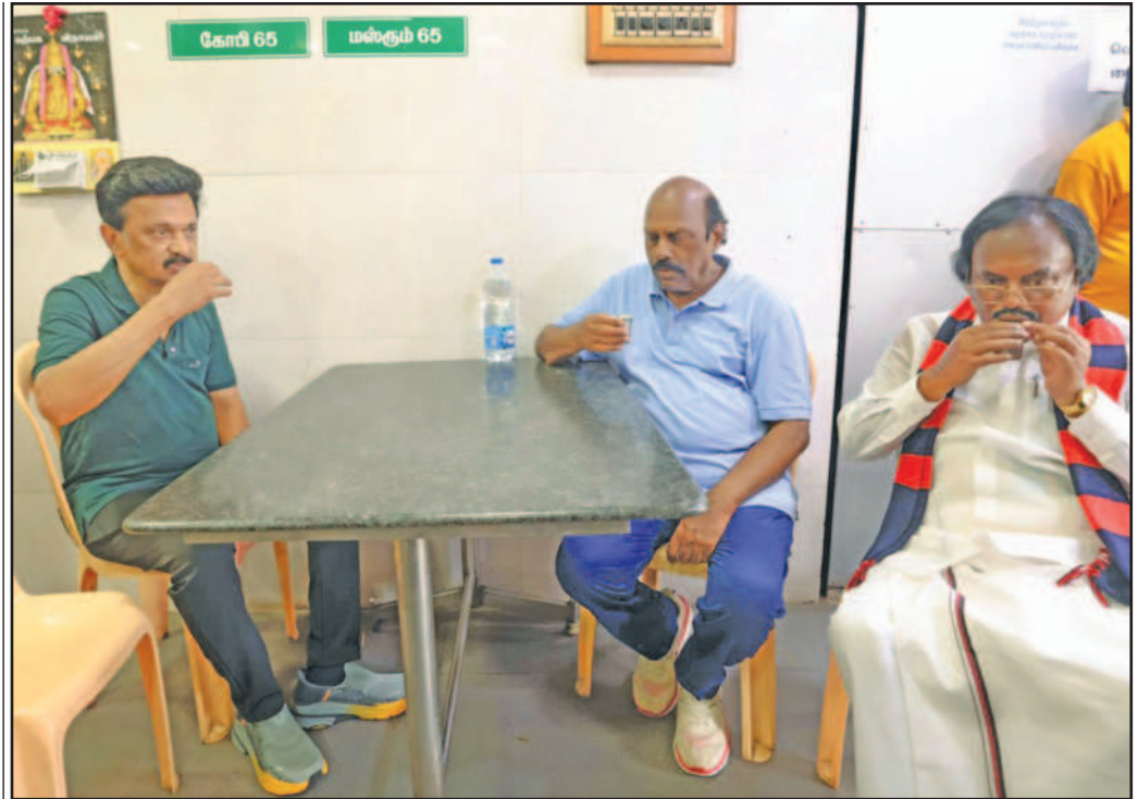
கழகத் தலைவரும் - முதலமைச்சருமான மு.க.ஸ்டாலின் அவர்கள் நேற்று முன்தினம் (8.4.2026) காலை திருவண்ணாமலையில் நடைபயணம் மேற்கொண்டபோது, அங்கு பொதுமக்களைச் சந்தித்து, திருவண்ணாமலை தொகுதி கழக வேட்பாளர் அமைச்சர் எ.வ.வேலு அவர்களை ஆதரித்து வாக்குச் சேகரித்தார்.