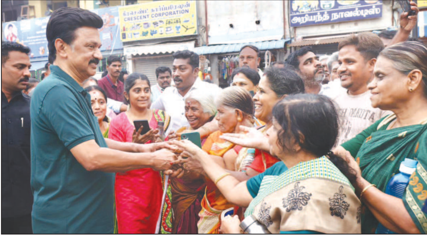
கழகத் தலைவரும் - முதலமைச்சருமான மு.க.ஸ்டாலின் அவர்கள் நேற்று முன்தினம் (8.4.2026) காலை திருவண்ணாமலையில் நடைபயணம் மேற்கொண்டபோது, அங்கு பொதுமக்களைச் சந்தித்து, திருவண்ணாமலை தொகுதி கழக வேட்பாளர் அமைச்சர் எ.வ.வேலு அவர்களை ஆதரித்து வாக்குச் சேகரித்தார்.