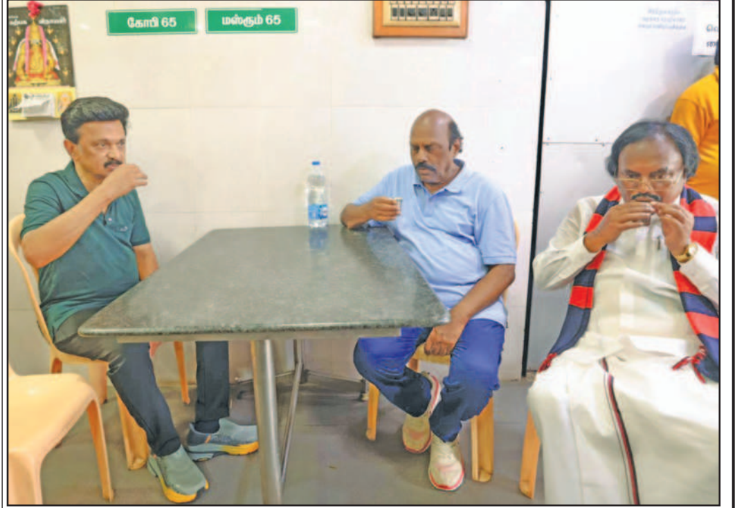
கழகத் தலைவரும் - முதலமைச்சருமான மு.க.ஸ்டாலின் அவர்கள் நேற்று முன்தினம் (8.4.2026) காலை திருவண்ணாமலையில் நடைபயணம் மேற்கொண்டபோது அங்குள்ள தேநீர் கடையில் தேநீர் அருந்தினார். உடன் திருவண்ணாமலை தொகுதி கழக வேட்பாளர் - அமைச்சர் எ.வ.வேலு, கீழ்பெண்ணாத்தூர் தொகுதி கழக வேட்பாளர் - துணை சபாநாயகர் கு.பிச்சாண்டி ஆகியோர் உள்ளனர்.