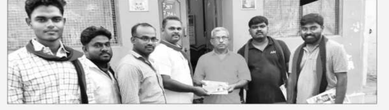
உடுமலைப்பேட்டை சட்டமன்றத் தொகுதி, திருப்பூர் தெற்கு மாவட்டம்.