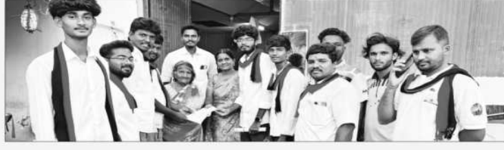
சங்ககிரி சட்டமன்றத் தொகுதி, சேலம் மேற்கு மாவட்டம்.