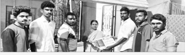
பாளையங்கோட்டை சட்டமன்றத் தொகுதி, திருநெல்வேலி மத்திய மாவட்டம்.