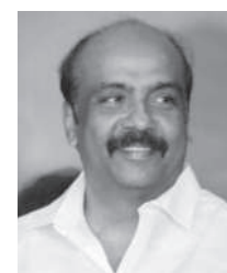
மருது அழகுராக் கழகச் செய்தித் தொடர்புக் குழு துணைத் தலைவர்