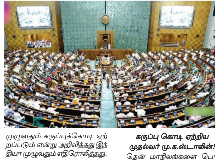
முழுவதும் கருப்புக்கொடி ஏற்றப்படும் என்று அறிவித்தது இந்தியா முழுவதும் எதிரொலித்தது.

புதுடெல்லி, ஏப்.18- தி.மு.க. உள்ளிட்ட எதிர்க்கட்சிகளின் கடும் எதிர்ப்பை மீறி மக்களவையில் கொண்டு வரப்பட்ட தொகுதி மறுவரையறை மசோதா தோல்வியடைந்தது. 3இல் 2 பங்கு பெரும் பாண்மை இல்லாததால் ஓன்றிய பா.ஜ.க. அரசு கொண்டு வந்த மசோதா தோல்வியடைந்தது.