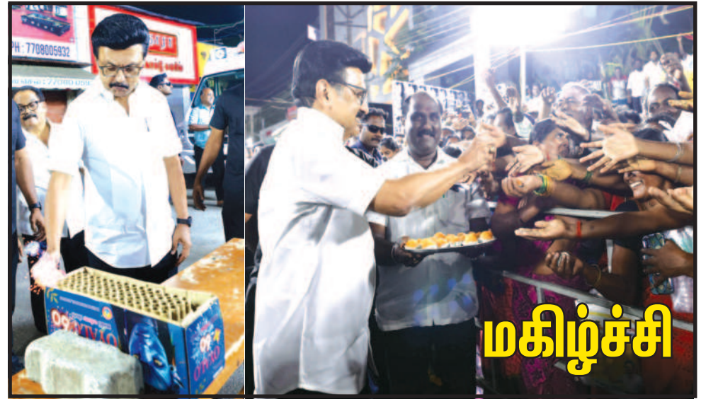
மக்களவையில் தொகுதிமறுவரையறை மசோதா தோல்வி அடைந்ததையடுத்து கழகத் தலைவர் - முதல்வர் மு.க.ஸ்டாலின் அவர்கள் ஆண்டிப்படியில் வாணவேடிக்கை வெடித்து, பொதுமக்களுக்கு இனிப்பு வழங்கி தனது மகிழ்ச்சியை வெளியிட்டுள்ளார்.

நின்ற அனைத்துத் தோழமைக் கட்சிகளுக்கும் என்னுடைய நன்றி!