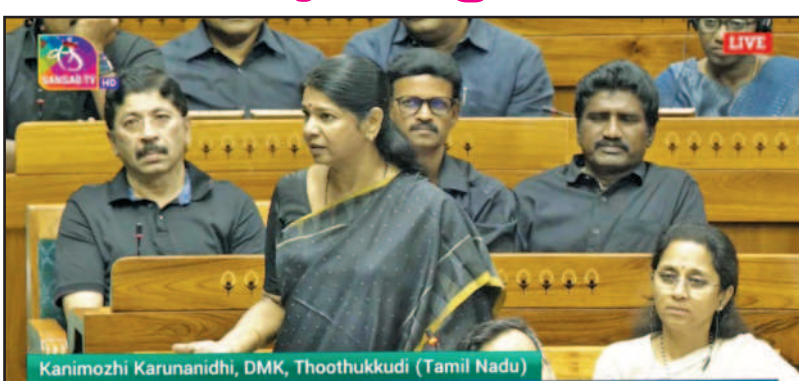
Kanimozhi Karunanidhi, DMK, Thoothukkudi (Tamil Nadu)

புதுடெல்லி, ஏப்.18- “கூட்டாட்சியின் குரலை நொிக்கவும் வகையிலும் - அரசியல் ஆதாயம் தேடுவதற்காகவே தொகுதி மறுவரையறை மசோதாவை ஒன்றிய பா.ஜ.க. அரசு தாக்கல் செய்துள்ளது” எனவும், “பெண்களை கேடயமாக வைத்து, இம்மசோதாவை நிறைவேற்றும் இத்திட்டத்தைச் செயல்படுத்த மோடி அரசு முயற்சிக்கிறது” எனவும் நாடாளுமன்ற கழகக் குழுத் தலைவர் - கனிமொழி கருணாநிதி மக்களவையில் கடுமையாக குற்றம் சாட்டினார்.