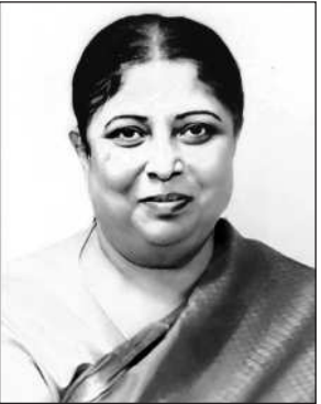
எல்லா மாநிலமும் திரும்பிப் பார்க்க வைக்கும் அளவிற்கு அரசு பள்ளிகள் தனியார் பள்ளிகளுக்கு நிகராக தரம் உயர்த்தப்பட்டுள்ளது என்பதை யாரும் மறுக்க முடியாது.