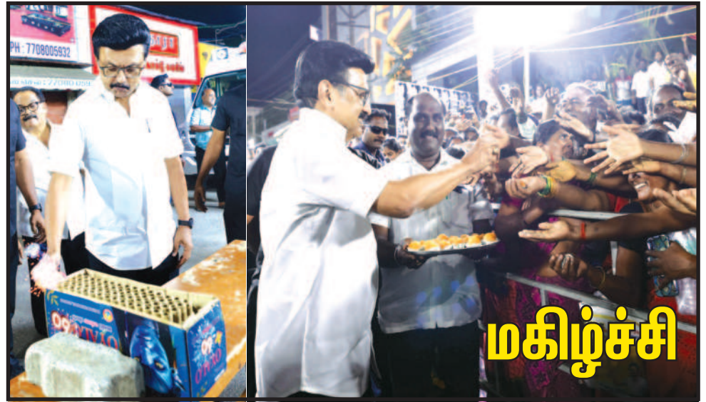
மக்களவையில் 'தொகுதி மறுவரையறை மசோதா' தோல்வி அடைந்ததைடுத்து தலைவர் - முதல்வர் மு.க.ஸ்டாலின் அவர்கள் திண்டுக்கல்லில் வாணவேட்களை வெடித்து, பொதுமக்களுக்கு இனிய வழங்கி தனது மகிழ்ச்சியை வெளியிடுத்திய காட்சி!

நின்ற அனைத்துத் தோழமைக் கட்சிகளுக்கும் என்னுடைய நன்றி!