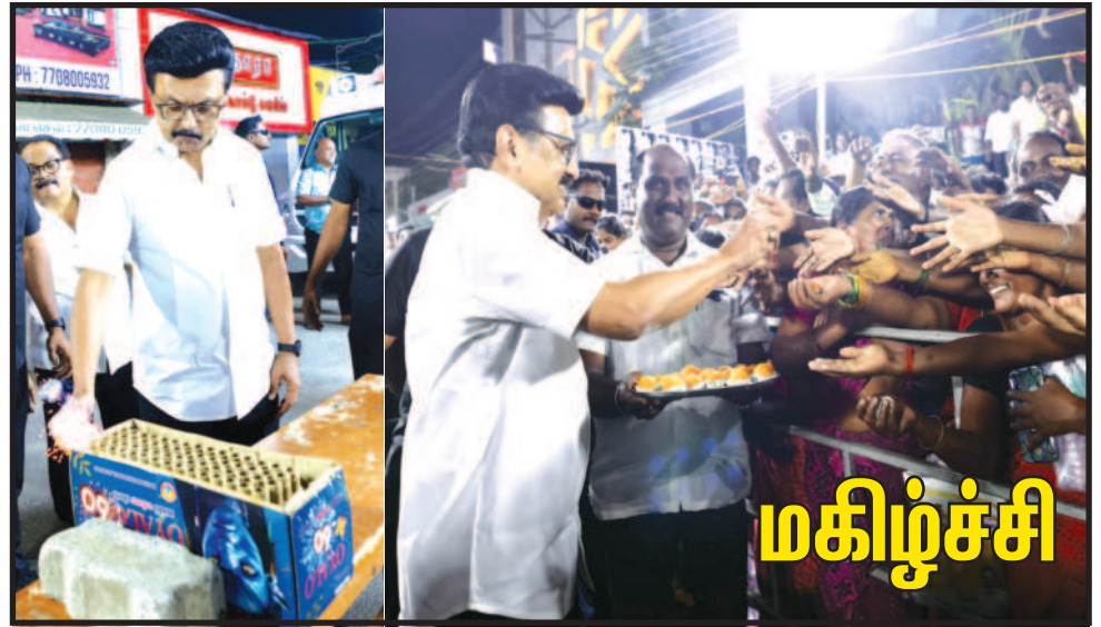
மக்களவையில் 'தொகுதி மறுவரையறை மசோதா' தோல்வி அடைந்ததையடுத்து தலைவர் - முதல்வர் மு.க.ஸ்டாலின் அவர்கள் திண்டுக்கல்லில் வாணவேட்களை வெடித்து, பொதுமக்களுக்கு இனிய வழங்கி தனது மகிழ்ச்சியை வெளியிடுத்திய காட்சி!

தமிழ்நாட்டின் உரிமைகளுக்கும், நமது இந்த அநீதியை எதிர்த்து ஓரணியில்