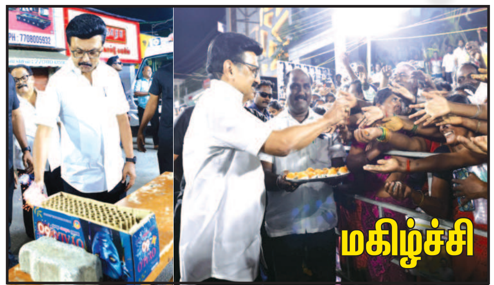
மக்களவையில் 'தொகுதி மறுவரையறை மசோதா' தோல்வி அடைந்ததையடுத்து தலைவர் - முதல்வர் மு.க.ஸ்டாலின் அவர்கள் திண்டுக்கல்லில் வாணவேட்களை வெடித்து, பொதுமக்களுக்கு இனிய வழங்கி தனது மகிழ்ச்சியை வெளியிடுத்திய காட்சி!

கலந்தாலோசித்து, அனைவரும் ஏற்றுக் கொண்ட, நியாயமான நடைமுறையையே நாம் வலியுறுத்தினோம். தமிழ்நாட்டின் உரிமைகளுக்கும், நமது இந்த அநீதியை எதிர்த்து ஓரணியில்