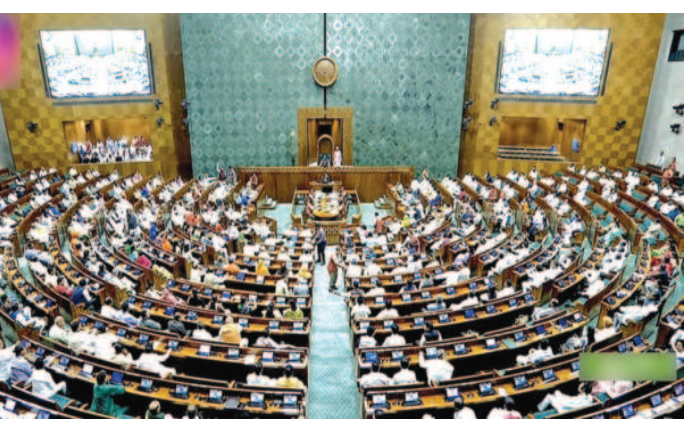
முழுமையும் கருப்புக்கொடி ஏற்றப்படும் என்று அறிவித்தது இந்தியா முழுவதும் எதிரொலித்தது. கருப்பு கொடி ஒன்றிய முதல்வர் மு.க.ஸ்டாலின்! தென் மாநிலங்களை

புதுடெல்லி, ஏப்.19 - தி.மு.க. உள்ளிட்ட எதிர்க்கட்சிகளின் கடும் எதிர்ப்பை மீறி மக்களவையில் கொண்டு வரப்பட்ட தொகுதி மறுவரையறை மசோதா தோல்வியடைந்தது. 3இல் 2 பங்கு பெரும் பான்மை இல்லாததால் ஒன்றிய பா.ஜ.க. அரசு கொண்டு வந்த மசோதா தோல்வியடைந்தது. ஒன்றிய பா.ஜ.க. அரசு தொகுதி மறுவரையறையை கொண்டு வந்து எப்படியும் நிறைவேற்றி தென் மாநிலங்களுக்கு வஞ்சகம் செய்ய நினைத்ததை கழகத் தலைவர், முதல்வர் மு.க.ஸ்டாலின் அவர்கள் தனது செயலால் தமிழ்நாடு