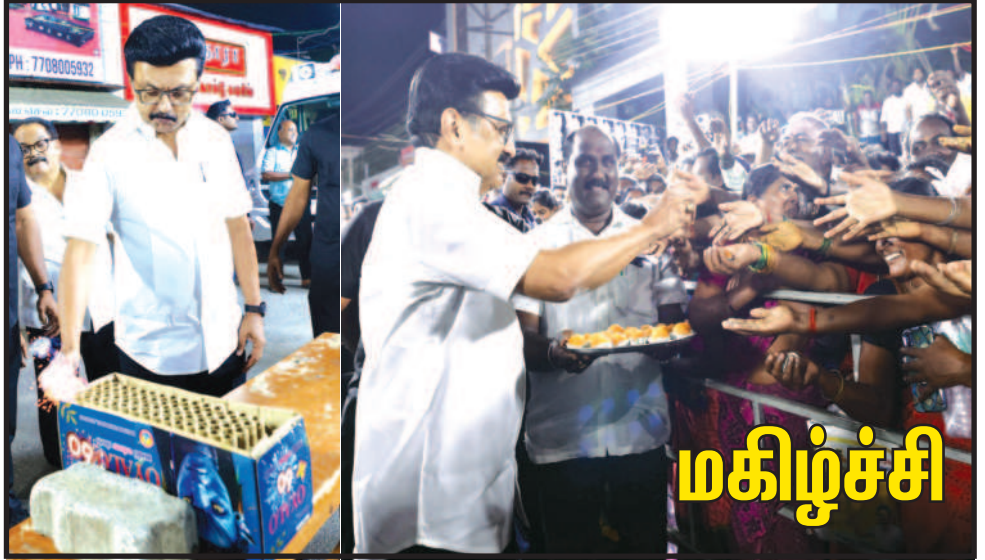
மக்களவையில் 'தொகுதி மறுவரையறை மசோதா' தோல்வி அடைந்ததைடுத்து தலைவர் - முதல்வர் மு.க.ஸ்டாலின் அவர்கள் திண்டுக்கலில் வாணவேட்களை வெடித்து, பொதுமக்களுக்கு இனிய வழங்கி தனது மகிழ்ச்சியை வெளியிடுத்திய காட்சி!

தமிழ்நாட்டின் உரிமைகளுக்கும், நமது இந்த அநீதியை எதிர்த்து ஓரணியில்