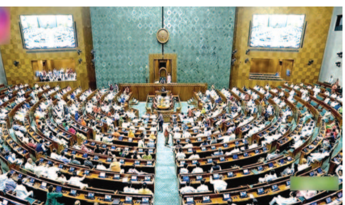
முழுமையும் கருப்புக்கொடி ஏற்றப்படும் என்று அறிவித்தது இந்தியா முழுவதும் எதிரொலித்தது. கருப்பு கொடி ஒன்றிய முதல்வர் மு.க.ஸ்டாலின்! தென் மாநிலங்களை

தி.மு.க. உள்ளிட்ட எதிர்க்கட்சிகளின் கடும் எதிர்ப்பை மீறி மக்களவையில் கொண்டு வரப்பட்ட தொகுதி மறுவரையறை மசோதா தோல்வியடைந்தது. 3இல் 2 பங்கு பெரும் பான்மை இல்லாததால் ஒன்றிய பா.ஜ.க. அரசு கொண்டு வந்த மசோதா தோல்வியடைந்தது. ஒன்றிய பா.ஜ.க. அரசு தொகுதி மறுவரையறையை கொண்டு வந்து எப்படியும் நிறைவேற்றி தென் மாநிலங்களுக்கு வஞ்சகம் செய்ய நினைத்ததை கழகத் தலைவர், முதல்வர் மு.க.ஸ்டாலின் அவர்கள் தனது செயலால் தமிழ்நாடு