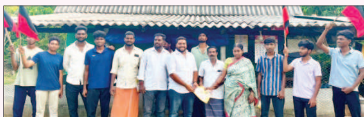
ஓரத்தநாடு சட்டமன்றத் தொகுதி, தஞ்சாவூர் மத்திய மாவட்டம்.