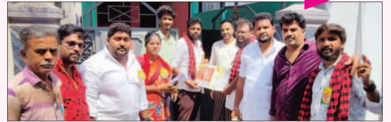
பழனி சட்டமன்றத் தொகுதி, திண்டுக்கல் கிழக்கு மாவட்டம்.