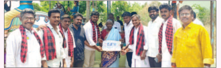
ஓமலூர் சட்டமன்றத் தொகுதி, சேலம் மத்திய மாவட்டம்.