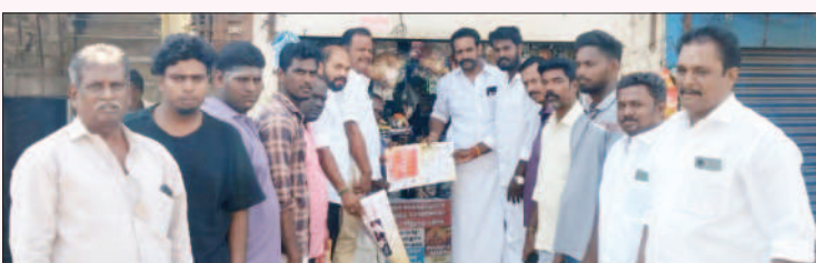
திருவாரங்கம் சட்டமன்றத் தொகுதி, திருச்சி மத்திய மாவட்டம்.