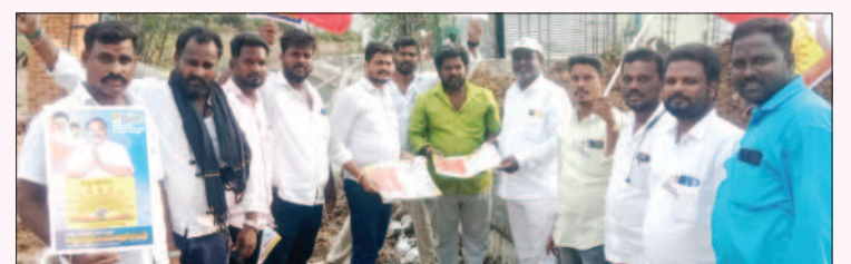
மாதவரம் சட்டமன்றத் தொகுதி, சென்னை வடகிழக்கு மாவட்டம்