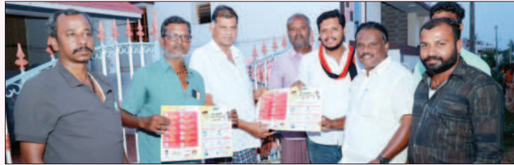
போடிநாயக்கனூர் சட்டமன்றத் தொகுதி, தேனி வடக்கு மாவட்டம்