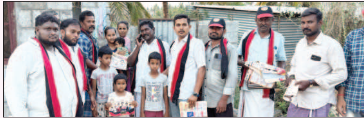
பவானிசாகர் சட்டமன்றத் தொகுதி, ஈரோடு வடக்கு மாவட்டம்.