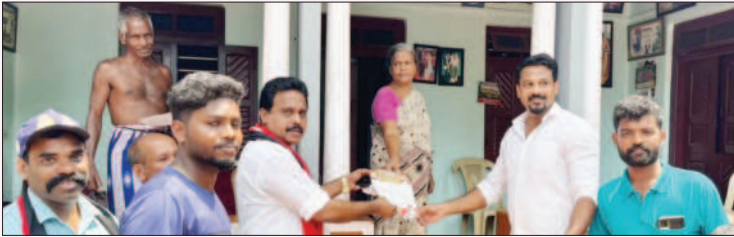
பத்மநாபபுரம் சட்டமன்றத் தொகுதி, கன்னியாகுமரி மேற்கு மாவட்டம்.