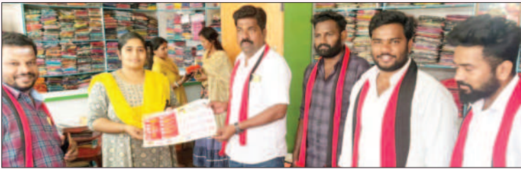
திருப்பூர் தெற்கு சட்டமன்றத் தொகுதி, திருப்பூர் மத்திய மாவட்டம்