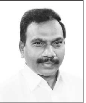
எதிர்நிலைப்பை பதிவு செய்தனர்.

புதுடெல்லி, ஏப். 20 - நாடாளுமன்ற மக்களவையில் தொகுதி மறுவரையறை மசோதா எதிர்க்கட்சிகளின் கட்டும் எதிர்ப்புகளுக்கு இடையே நேற்று முன்தினம் தாக்கல் செய்யப்பட்டது.