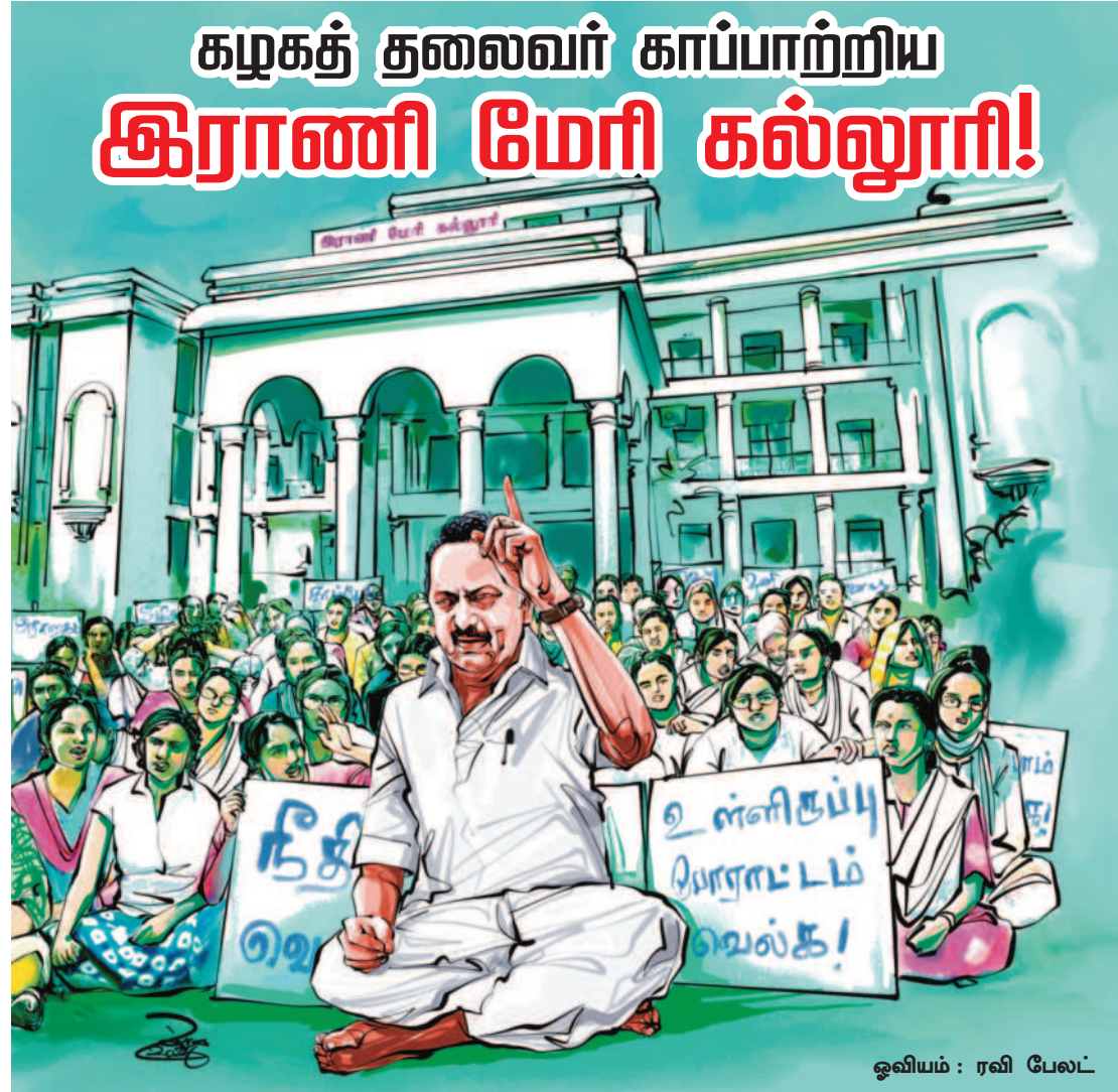
ஒலியம் : ரவி பேலட்

தலைவர் கைது செய்யப்பட்டு இரவோடு இரவாக கடலூர் மத்திய சிறைக்குக் கொண்டு செல்லப்பட்டு, ஒரு மாத காலம் சிறையில் அடைக்கப்பட்டிருந்தார்.