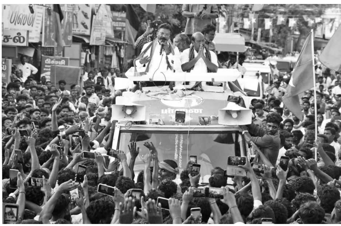
தஞ்சாவூர் மாவட்டம் திருவிடைமருதூர் தொகுதியில் மதச்சார்பற்ற முற்போக்கு கூட்டணியின் சார்பில் போட்டியிடும் கழக வெற்றி வேட்பாளர் உயர்கல்வித்துறை அமைச்சர் முனைவர் கே.வி.செழியனை ஆதரித்து விடுதலை சிறுத்தைகள் கட்சி தலைவர் தொல்.திருமாவளவன் திருவிடைமருதூர் பகுதியில் வாக்கு சேகரித்தார்.